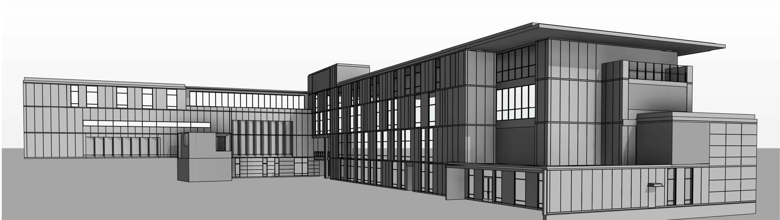
3D MODEL – EXTERNAL FACADES ONLY LOOKING APPROX SOUTH EAST