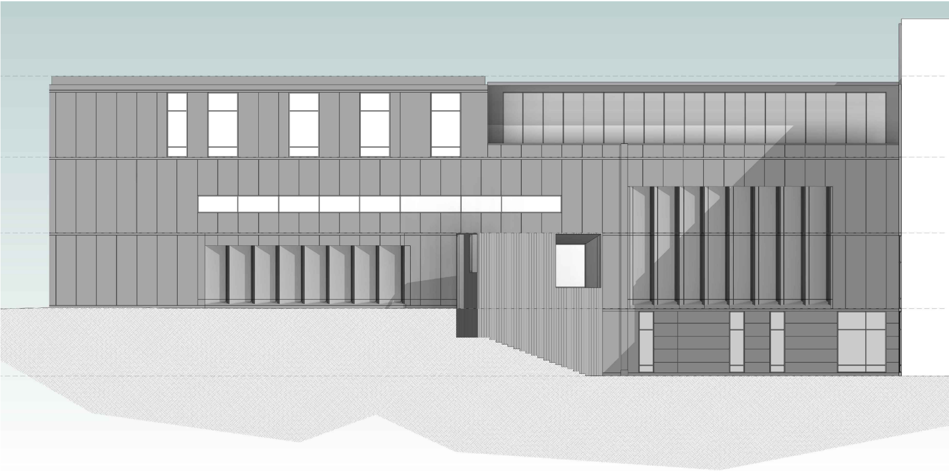
WEST 1A ELEVATION NO SCALE