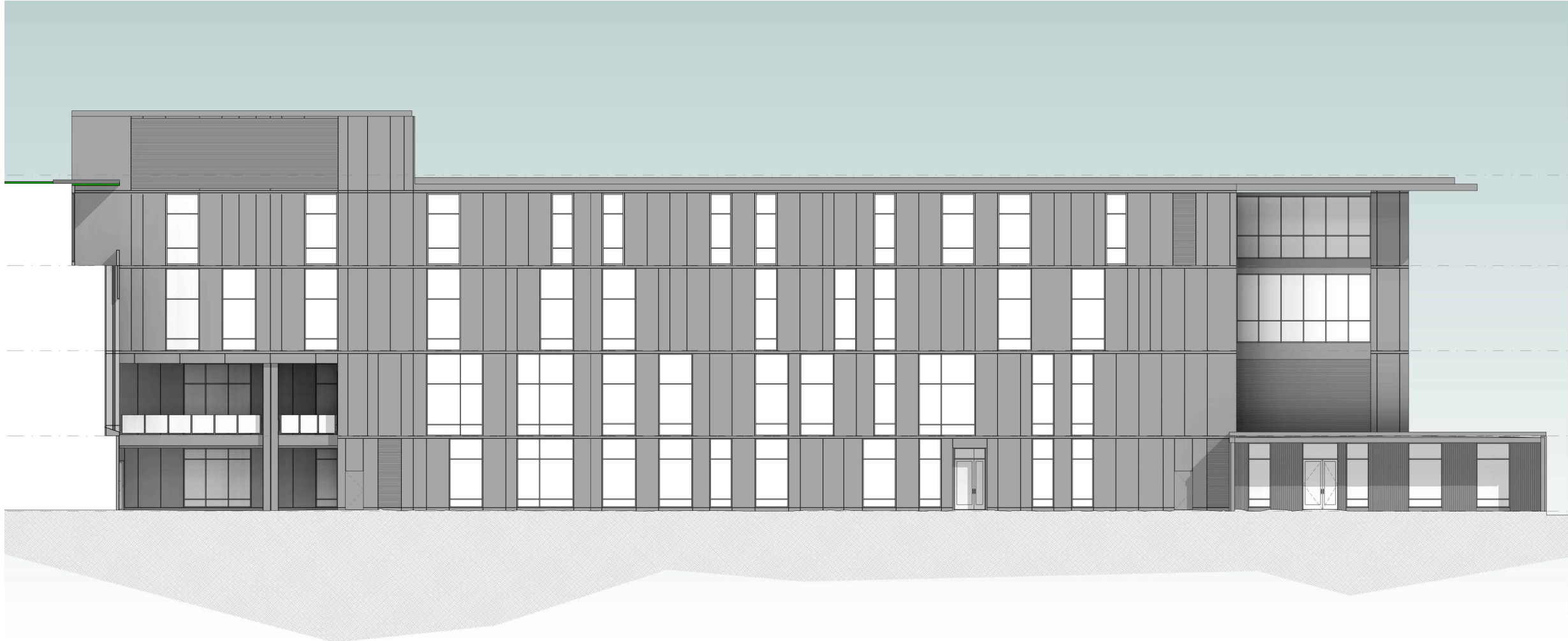
NORTH ELEVATION NO SCALE